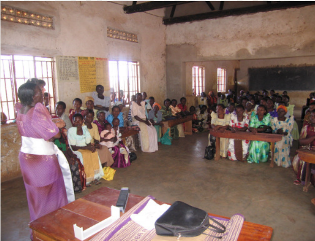
Zusammenkunft der ugandischen Frauen in der St. Kizito– Schule