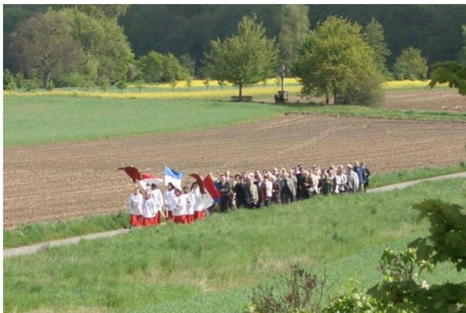
Christi Himmelfahrt 2008

Vor Jahren zeigte uns ein vorbeifahrender Autofahrer den Vogel, als er unsere